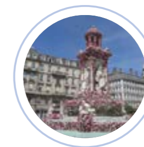
Lyon, capitale mondiale de la gastronomie

Inscrite au patrimoine mondial de l'Unesco : musées, festivals, quartiers et monuments historiques à explorer