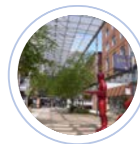
Lyon ville de culture

Lyon Bleu International est ambassadeur Only Lyon/Office du tourisme