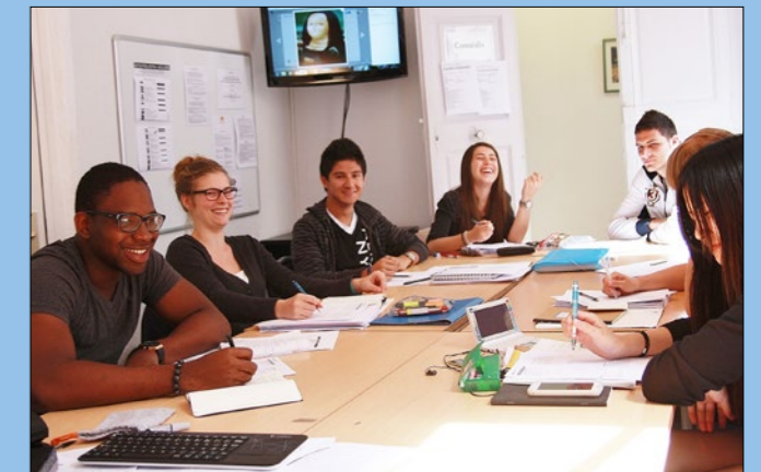
Estudiantes de varios países se registran en la ILA

La escuela de francés ILA se sitúa en la «Grand Rue Jean Moulin», una de las calles más atractivas en el centro histórico de Montpellier. Esta calle se encuentra en una zona peatonal con varias pequeñas tiendas, gastronómicas y cafeterías típicas. Nuestra escuela de francés está en frente de la Cámara de Comercio.