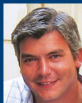
Francisco (España) «Tercera vez en ILA estupendo!»