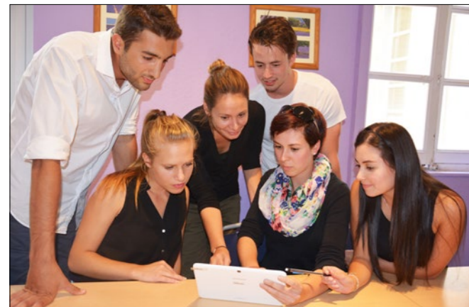
Durante las clases