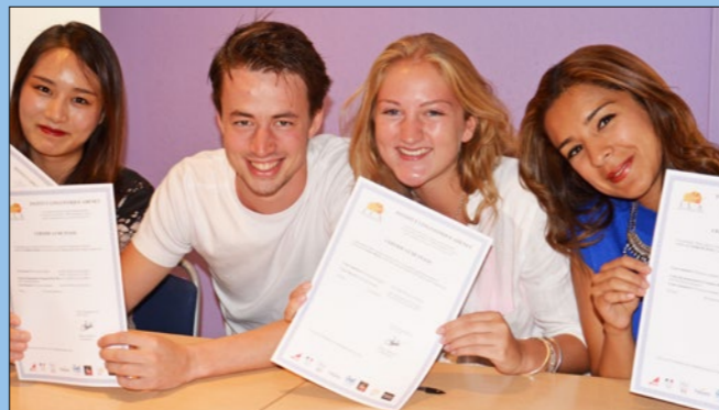
Etudiants de la ILA avec leurs certificats

«ILA a été inspecté par EAQUALS et a répondu aux standards élevés requis pour obtenir l'accréditation EAQUALS. L'enseignement, les programmes de cours, l'organisation et les ressources pédagogiques ainsi que les tests et évaluations ont tous été jugés de grande qualité. Il a été constaté que ILA prend grand soin du bien-être de ses clients et de son personnel, et que tous les matériaux publicitaires produits par ILA se sont avérés exacts et conformes à la réalité.»