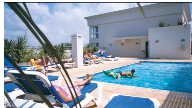
Terraza de la piscina del Apart'hotel