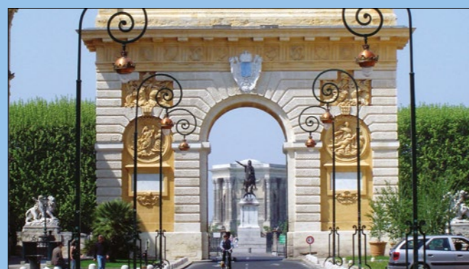
El Arco de Triunfo de Montpellier