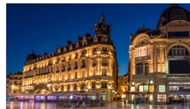
Place de la Comédie Montpellier

Yoko (Japón) «Montpellier es una ciudad fantástica. Con un magnífico centro histórico, y muchas atracciones muy chulas para la vida estudiantil. Las actividades de ILA ofrecen excursiones excelentes.»