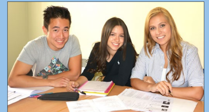
Clases de pequeños grupos en ILA