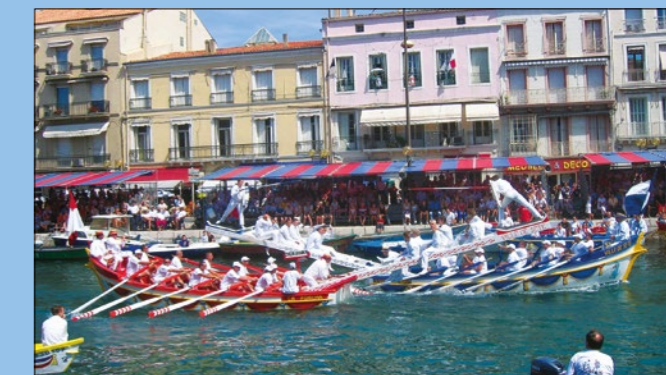
Justas náuticas en el festival de Sète