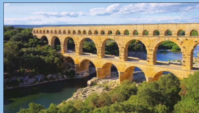
Una(s) de las excursiones con ILA - Pont du Gard

Notre programme comprend des visites de Montpellier, des visites culturelles (théâtre ou musée), des dégustations de vins et de fromages, des soirées à thèmes, des pots d'accueil et de départ, des soirées étudiantes, des soirées d'échanges linguistiques avec des Français ainsi que des excursions vers des sites Unesco et les hauts-lieux de la région (ex: Avignon, Pont du Gard, Carcassonne, Nîmes, Sète, Camargue, Provence).