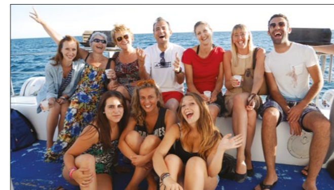
Catamarán (crucero) durante el atardecer con ILA

Nuestro programa ofrece visitas de Montpellier, visitas culturales de museos y teatros, degustación de vinos y quesos, reuniones sociales y fiestas de bienvenida y de despedida, fiestas estudiantiles, noches de intercambios lingüísticos con franceses y excursiones en los lugares más relevantes de la región (por ejemplo, Avignon, Le pont du Gard, Carcassonne, Nîmes, Sète, Camargue, Provence, Aix-en-Provence ect.).