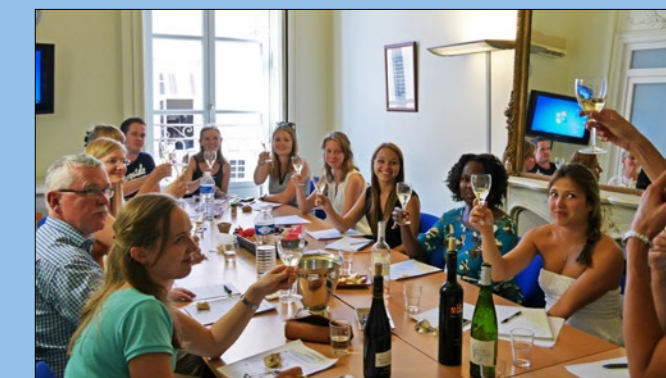
Cata de vinos con ILA