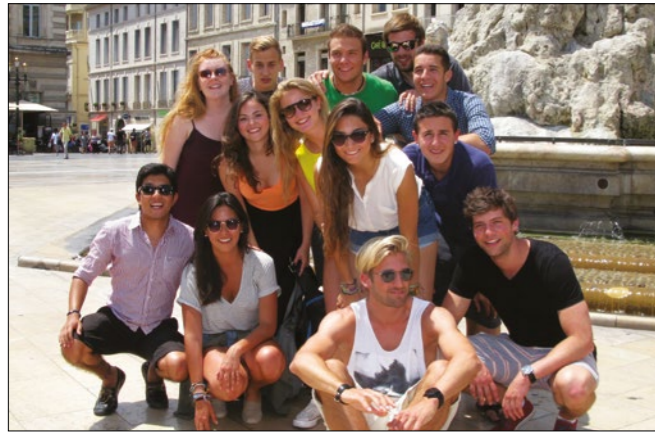
Estudiantes de la escuela ILA (Place de la Comédie)

Vous souhaitez vous initier à la langue française, être capable de communiquer rapidement ou vous voulez perfectionner vos acquis. Vous disposez de quelques semaines ou de plusieurs mois. Vous désirez étudier dans une région française attrayante en été comme en hiver. ILA vous permet de réaliser vos objectifs en vous proposant des prestations de qualité à tout niveau. Notre engagement envers vous est la garantie d'un séjour réussi. En plus d'un enseignement efficace, dispensé par des professeurs confirmés et enthousiastes dans une atmosphère à la fois studieuse et cordiale, nous nous tenons à votre disposition pour vous assurer le meilleur séjour possible.