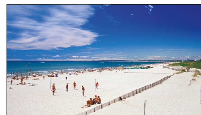
Las playas cerca de Montpellier