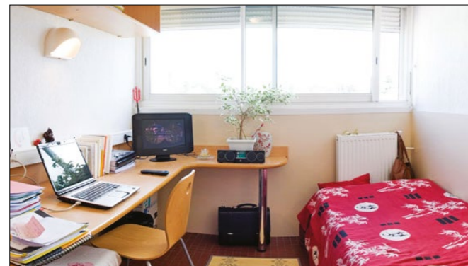
Cuarto en el campus de la universidad

Une fois inscrit à ILA, nous vous demanderons de remplir un questionnaire afin de découvrir vos habitudes et intérêts. Ceci nous aidera à vous placer dans une famille correspondant à vos besoins. Nous connaissons toutes nos familles personnellement et avons inspecté leur lieu de vie. Nous avons la réputation de fournir d'excellentes familles d'accueil.