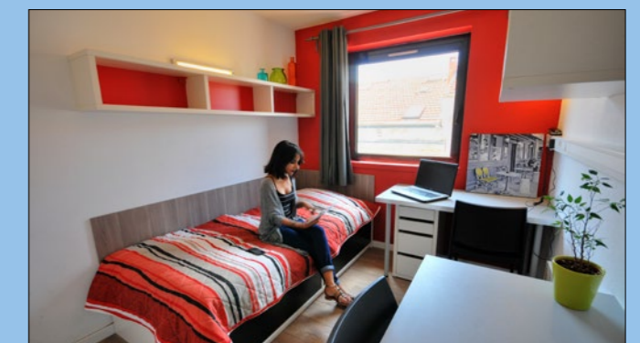
Cuarto confortable en una de nuestras residencias