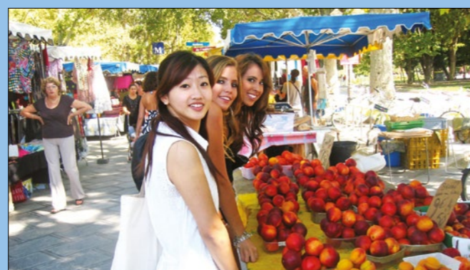
Estudiantes de la ILA descubriendo el mercado local