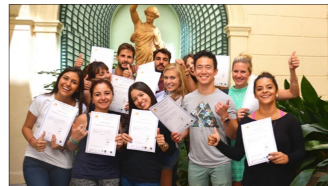
Estudiantes ILA orgullosos de sus certificados