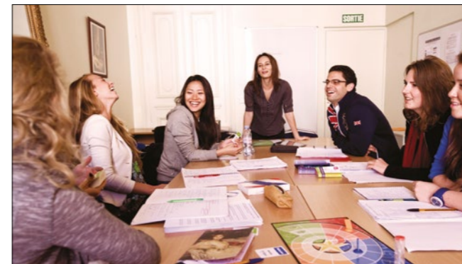
Una enseñanza eficaz y animada

«ILA fue inspeccionado por EAQUALS y corresponde con los altos estándares requerido por la acreditación de EAQUALS. La enseñanza, los programas de cursos, así como la organización de los cursos, los recursos de aprendizaje, las pruebas y la evaluación fueron considerados de alta calidad. Se encontró que la institución tiene mucho cuidado para proteger el bienestar de sus clientes, el personal y todos los materiales de publicidad producido por la institución son exactos y verdaderos.»