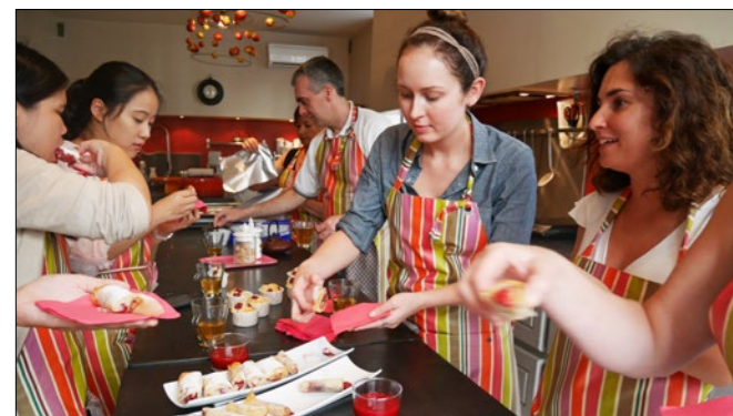
Curso de cocina con ILA