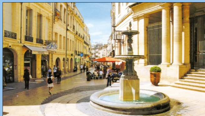
Ubicación fantástica de la ILA - Grand Rue Jean Moulin