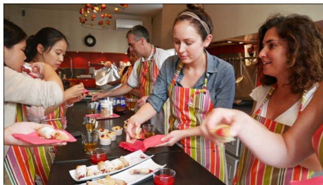
ILA Freizeitaktivität - Kochkurs