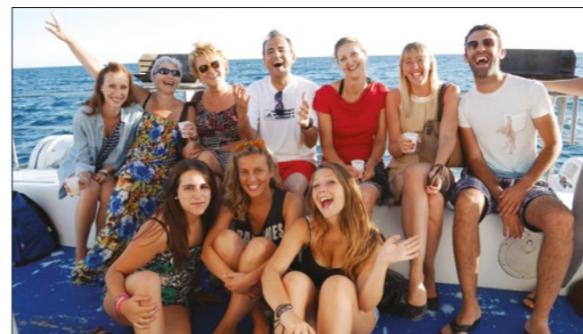
ILA Katamaran Sunset Cruise

Unser Programm beinhaltet verschiedene Besuche in Montpellier, kulturelle Besuche wie Museen oder Theater, Wein und Käseverkostungen, gesellige Abende, Begrüßungsparties, Sprachaustauschende mit Franzosen sowie Exkursionen zu UNESCO Sehenswürdigkeiten der Umgebung (Avignon, Pont Du Gard, Carcassonne, Nîmes, Sète, Camargue, Provence etc.) an.