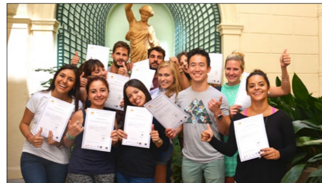
ILA Kursteilnehmer stolz auf Ihre Zertifikate

Sie möchten Französisch lernen oder Ihre vorhandenen Kenntnisse erweitern und dabei schnelle Fortschritte machen, um selbständig kommunizieren zu können. Sie haben einige Wochen oder mehrere Monate zur Verfügung und möchten in einer der sowohl im Sommer als auch im Winter attraktivsten Regionen Frankreichs studieren. Damit Sie Ihre Lernziele erreichen, haben wir bei ILA uns einen hohen Qualitätsanspruch auferlegt, der Ihre Garantie für einen erfolgreichen Aufenthalt ist. Neben einem effizienten Unterricht und einer seriösen und freundlichen Atmosphäre sehen wir es als unsere Aufgabe an, Ihnen während Ihres Aufenthaltes jederzeit beratend zur Verfügung zu stehen. Willkommen bei ILA!