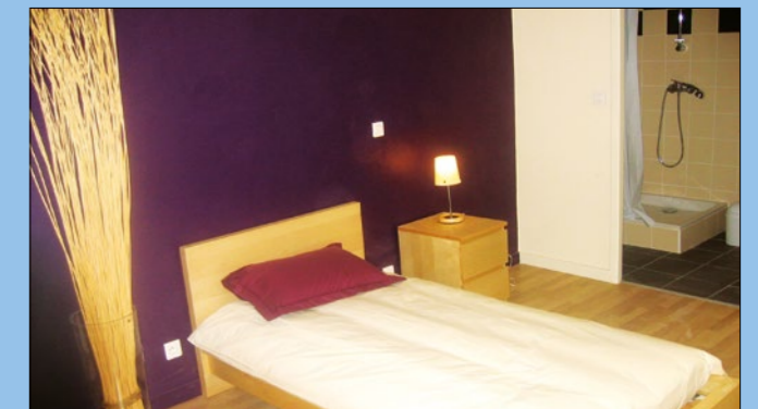
Zimmer mit privatem Badezimmer in unserer Studentenresidenz

Nachdem Sie sich bei uns angemeldet haben, füllen Sie einen Fragebogen über Ihre Gewohnheiten und Interessen aus. Dieser wird uns helfen Sie in einer Familie, die am besten zu Ihnen passt, zu buchen. Wir kennen alle unsere Familien persönlich und haben ihre Unterkünfte inspiziert. Wir haben den Ruf exzellente Gastfamilien zu vermitteln.