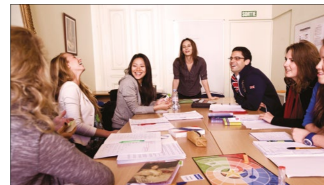
Eine lebendige, effiziente Unterrichtsmethode

«ILA wurde von EAQUALS geprüft und erfüllte die höchsten Standards, die für die EQUALS-Zulassung erforderlich sind. Unterricht, Kursprogramme, Kursorganisation, Lernmittel, Tests und Auswertung wurden alle mit hoher Qualität bewertet. Wir fanden heraus, dass die Institution große Sorgfalt walten lässt, um das Wohlergehen ihrer Klienten und Mitarbeiter zu schützen, und alle Werbematerialien, die von der Lehranstalt hergestellt wurden, sind akkurat und wahrheitsgemäß.»