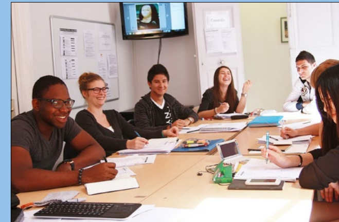
Studenten aus vielen verschiedenen Ländern bei ILA

Unser Institut befindet sich in der « Grand Rue Jean Moulin », einer der attraktivsten Adressen im Herzen der Altstadt Montpelliers. In dieser Fußgängerzone befinden sich viele Boutiquen, Feinkostläden und Cafés. Eine exzellente Lage, genau gegenüber dem beeindruckenden Gebäude der Handelskammer Montpellier.