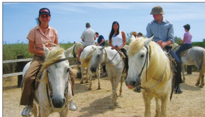
ILA Ausflug in die Camargue - Pferdeausritt