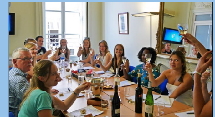
Weinprobe bei ILA