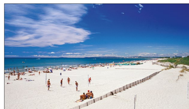
Montpellier bietet lange Sandstrände