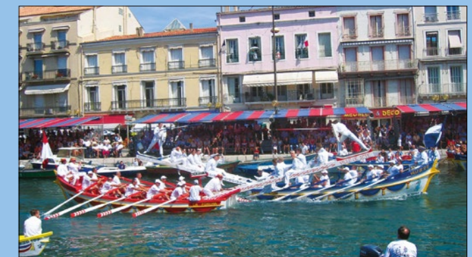
Das "Joutes" Festival in Sète