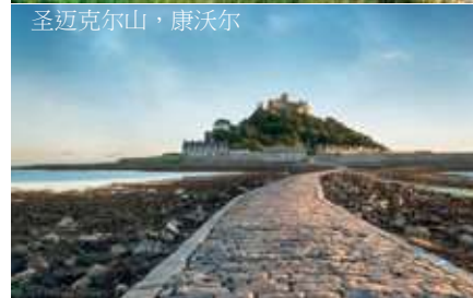
圣迈克尔山，康沃尔